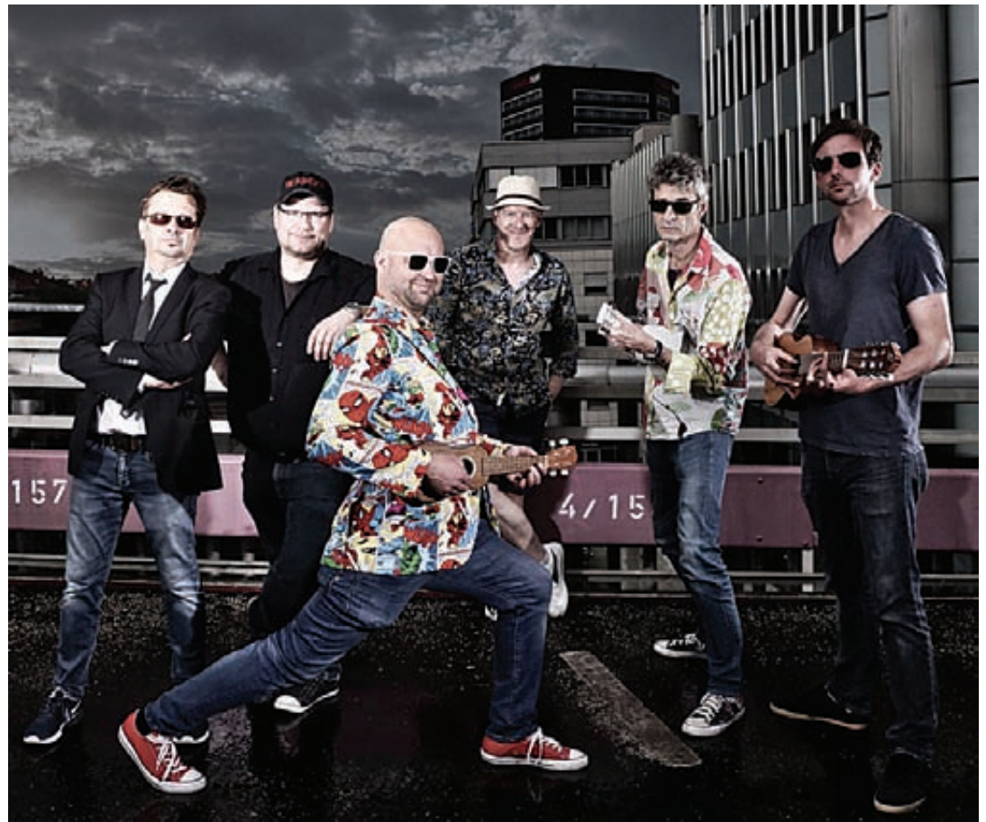
Die Gruppe „Salon Herbert Royal“ besteht aus sechs Journalisten aus Hannover, die nun am 28. Oktober in der Ernst-Reuter-Schule auftreten wird.