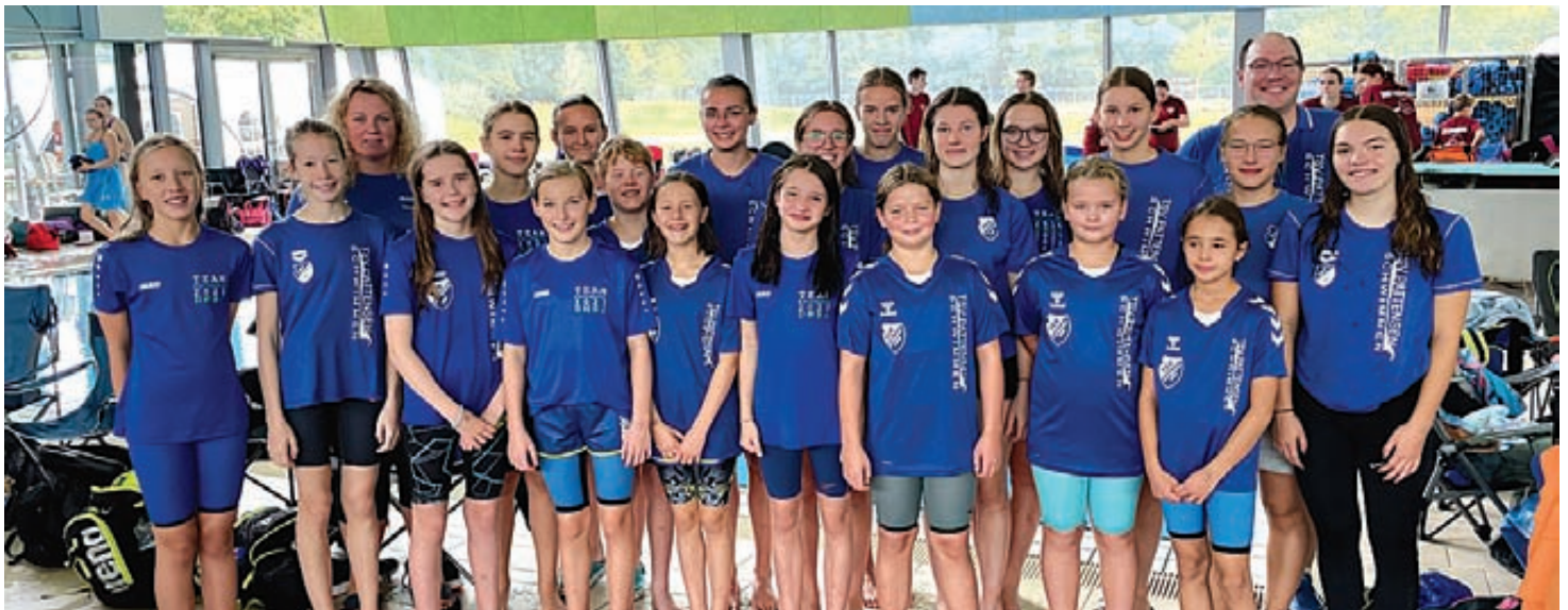
Die Aktiven des TSV Pattensen erwischten beim Wettkampf am letzten September-Wochenende einen glänzenden Tag.

Besonders bemerkenswert ist also, dass alle vier beim Wettkampf gestarteten Staffeln des TSV Pattensen eine Treppchen-Platzierung erreichen und somit ihre Vormachtstellung im Bezirksschwimmverband Hannover unter Beweis stellen konnten. Auch beim nun folgenden DMSJ-Landesentscheid der jeweils acht besten Mannschaften jeder Altersklasse aus ganz Niedersachsen, der Anfang Dezember im Wasserpark Hildesheim stattfindet, zählen die TSV-Aktiven zum engeren Favoritenkreis und werden sicherlich auch hier wieder mit Medaillen in die Heimat nach Pattensen zurückkehren.