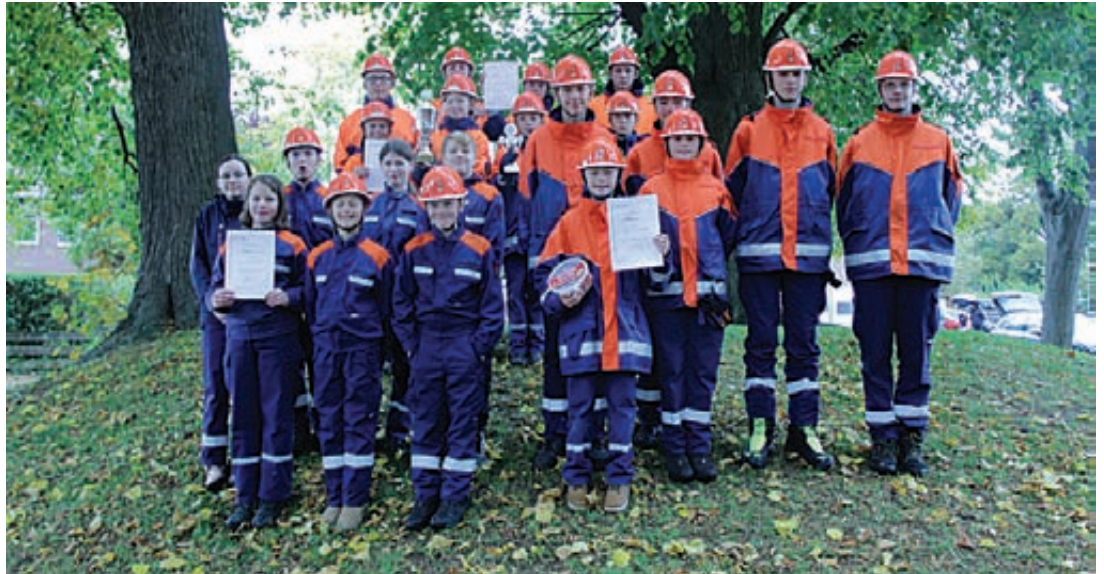
Die Staffeln der Jugendfeuerwehren Oerie (links, dritter Platz), Pattensen (rechts, zweiter Platz) und Koldingen-Reden (hinten, erster Platz).

auch wieder der Rotarypokal statt. Hier mussten die Jugendlichen auf Zeit eine Schlauchleitung ausrollen und drehungsfrei verlegen. Hier konnte sich die Jugendfeuerwehr Koldingen-Reden erneut als beste Mannschaft beweisen.