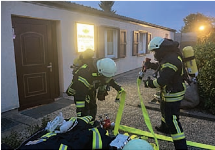
Die Kameraden der Feuerwehr bereiten den Einsatz bei der Übung am Schützenhaus vor.