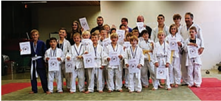
Die Judoka des TSV Pattensen haben sich am 24. September zur Vereinsmeisterschaft getroffen.