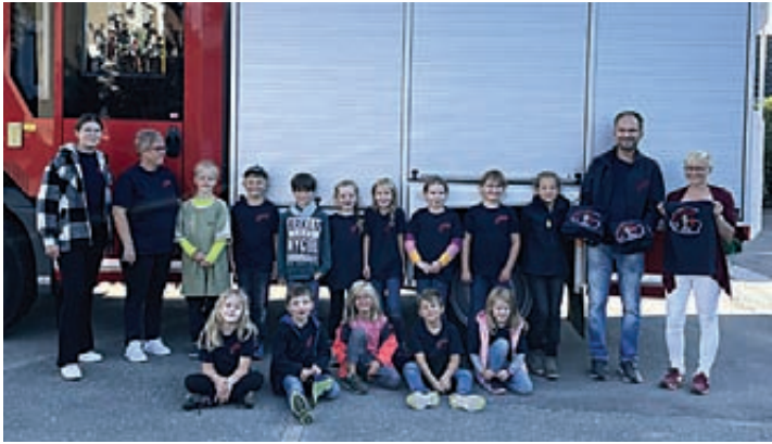
Die Jungen und Mädchen der Kinderfeuerwehr Schulenburg präsentieren ihre neuen T-Shirts.