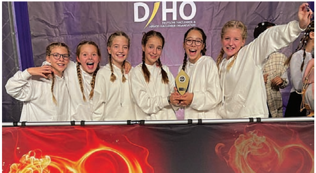
Die Tänzerinnen vom Tanzstudio Gregor in Hemmingen freuen sich über die tollen Erfolge bei den Deutschen Meisterschaften.

Platz in der A-Reihe für sich gewinnen können. Mit diesem erfolgreichen Ergebnis hat sich das viele Training für die Tänzerinnen aus Hemmingen und Pattensen mehr als gelohnt und wird nun eifrig für die Vorbereitung auf die kommende „European Masters of Dance“ am 12. November in Weinheim motiviert fortgeführt.