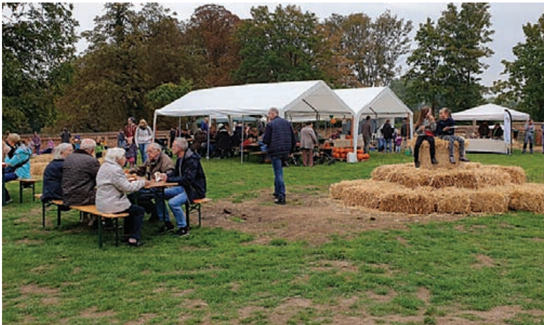
Zahlreiche Besucher nutzten die Gelegenheit und genossen das erste Erntefest der Dorfgemeinschaft in Reden auf dem Gut Reden.

Der Verein zur Förderung der Dorfgemeinschaft Reden bedankt sich bei allen Helfern, die die Organisation und Durchführung des Festes unterstützt und so dieses Fest erst ermöglicht haben. Ein besonderer Dank gilt der Familie von Reden für die Nutzung des Geländes. Das Erntefest war eine gelungene Veranstaltung. Der Zusammenhalt der Einwohner und Helfer war spürbar und die Dorfgemeinschaft kann stolz sein, gemeinsam dieses Fest auf die Beine gestellt zu haben.