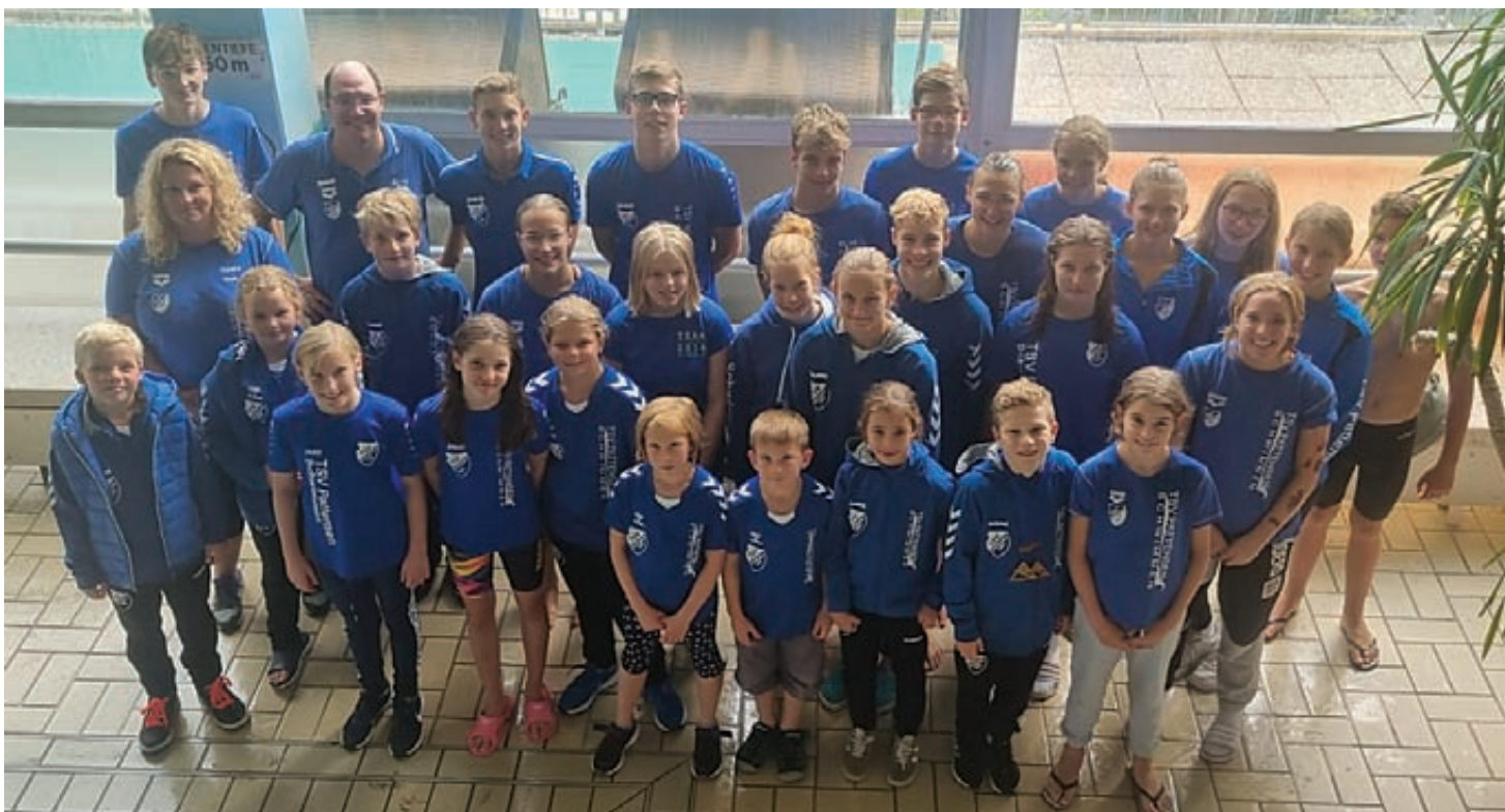
Die Schwimmer des TSV Pattensen überzeugten bei ihren 194 Einzelmeldungen mit vielen ersten Plätzen.