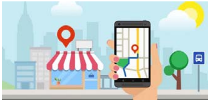
Immer mehr Menschen suchen online nach lokalen Unternehmen und Dienstleistungen vor Ort.

Lokales SEO eignet sich besonders für alle Unternehmen, die