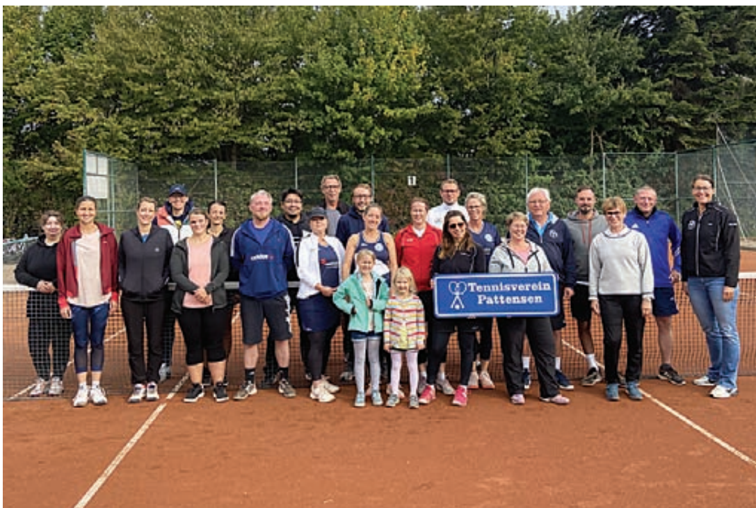
Zum offiziellen Saisonabschluss spielten die etwa 20 Mitglieder des Tennisvereins Pattensen ein Schleifchenturnier.