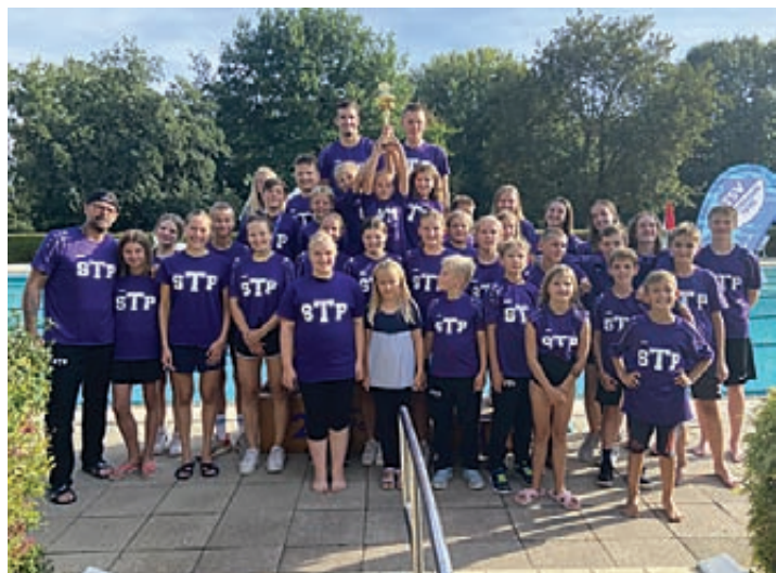
Das Swim Team Pattensen nahm mit mehr als 40 Schwimmerinnen und Schwimmern am August-Bötger-Pokal teil.