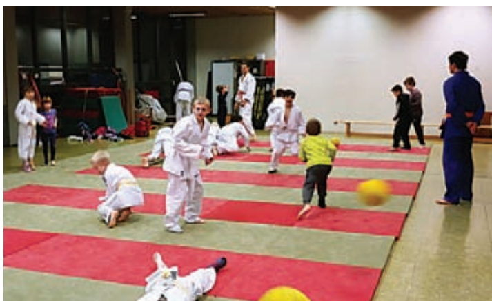
Bei den Trainingseinheiten der Judo-Sparte ist immer viel Bewegung und Spaß angesagt.

Über reges Interesse würden sich die Judotrainer des TSV Pattensen freuen. Bei Fragen und Anmeldungen einfach unter der E-Mailadresse tsv-pattensen-judo@web.de melden.