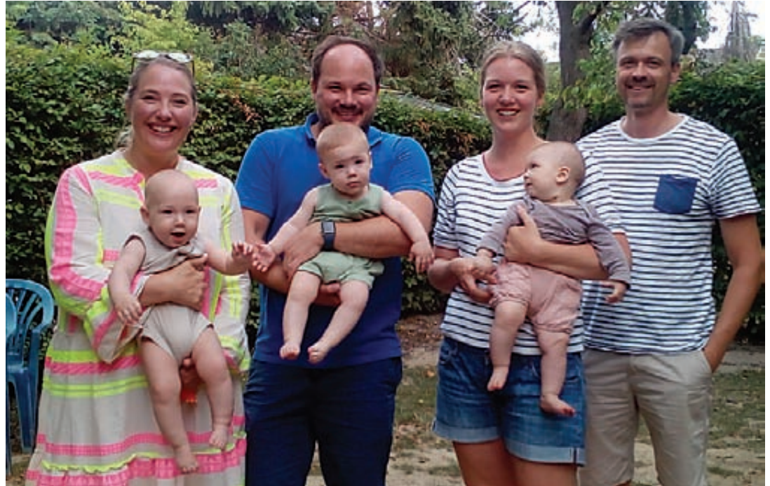
Strahlende Gesichter gab es beim Neugeborenen-Treff im Mehrgenerationenhaus. Insgesamt waren 23 Mütter und Väter dabei, um sich kennenzulernen und auszutauschen.