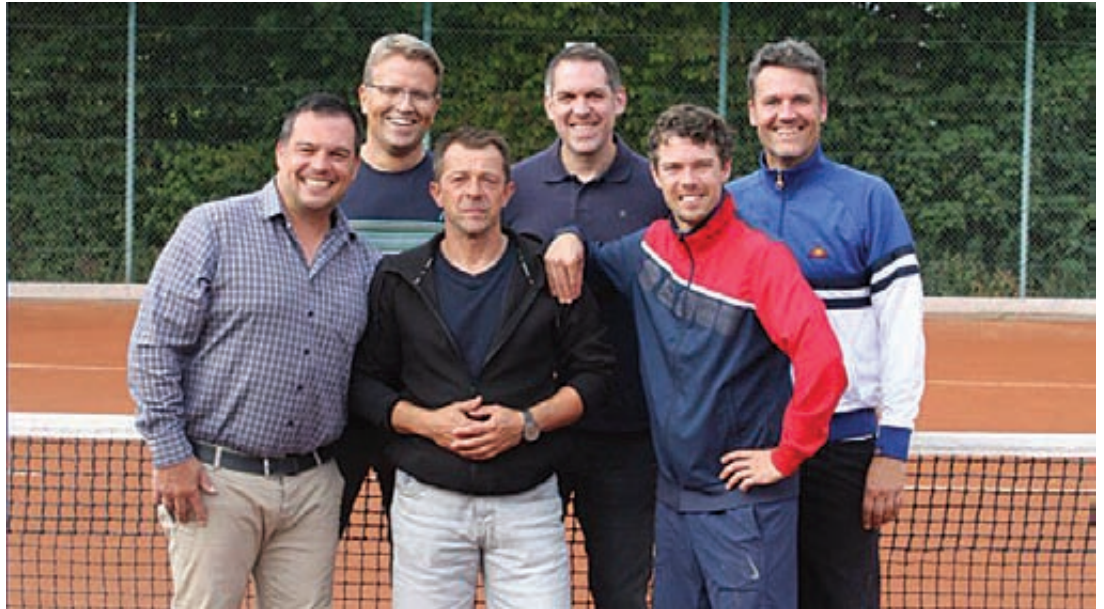
Die Herren 40 des Tennisvereins Pattensen sind in dieser Saison sehr erfolgreich gewesen und krönten ihre Leistungen mit dem Aufstieg in die Verbandsklasse.

Jubiläumjahr wiederholt werden. Denn nächstes Jahr wird der Verein 50 Jahre alt. Als I-Tüpfelchen der Saison hat die Herren II im Vereinspokal das Halbfinale erreicht. Dort unterlag man Eintracht Braunschweig mit 1:2.