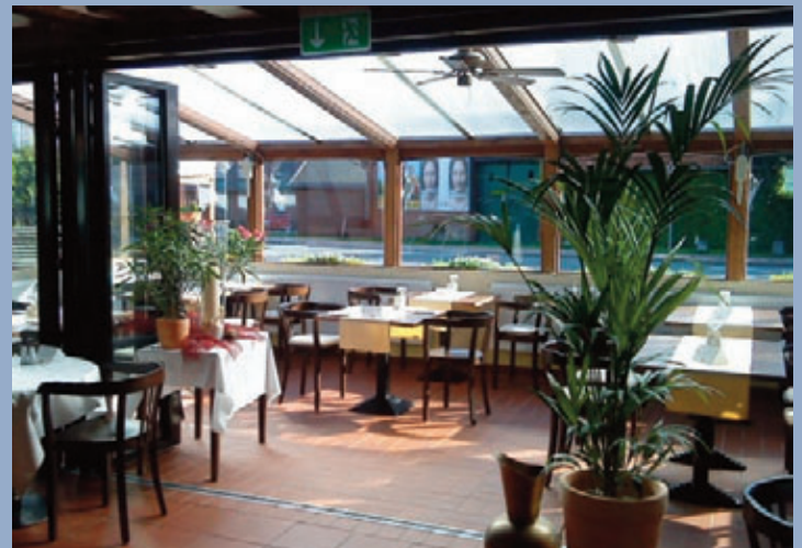
Das Hotel Zur Linde in Pattensen: 28 Zimmer, Säle für kleine und größeren Veranstaltungen, das Restaurant bestehend aus Gaststube und Salons.