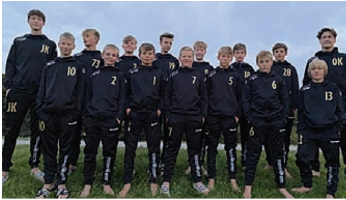
Die C-Füchse des SV Eintracht Hiddestorf gehen mit neuen Trainingsanzügen in die neue Saison.