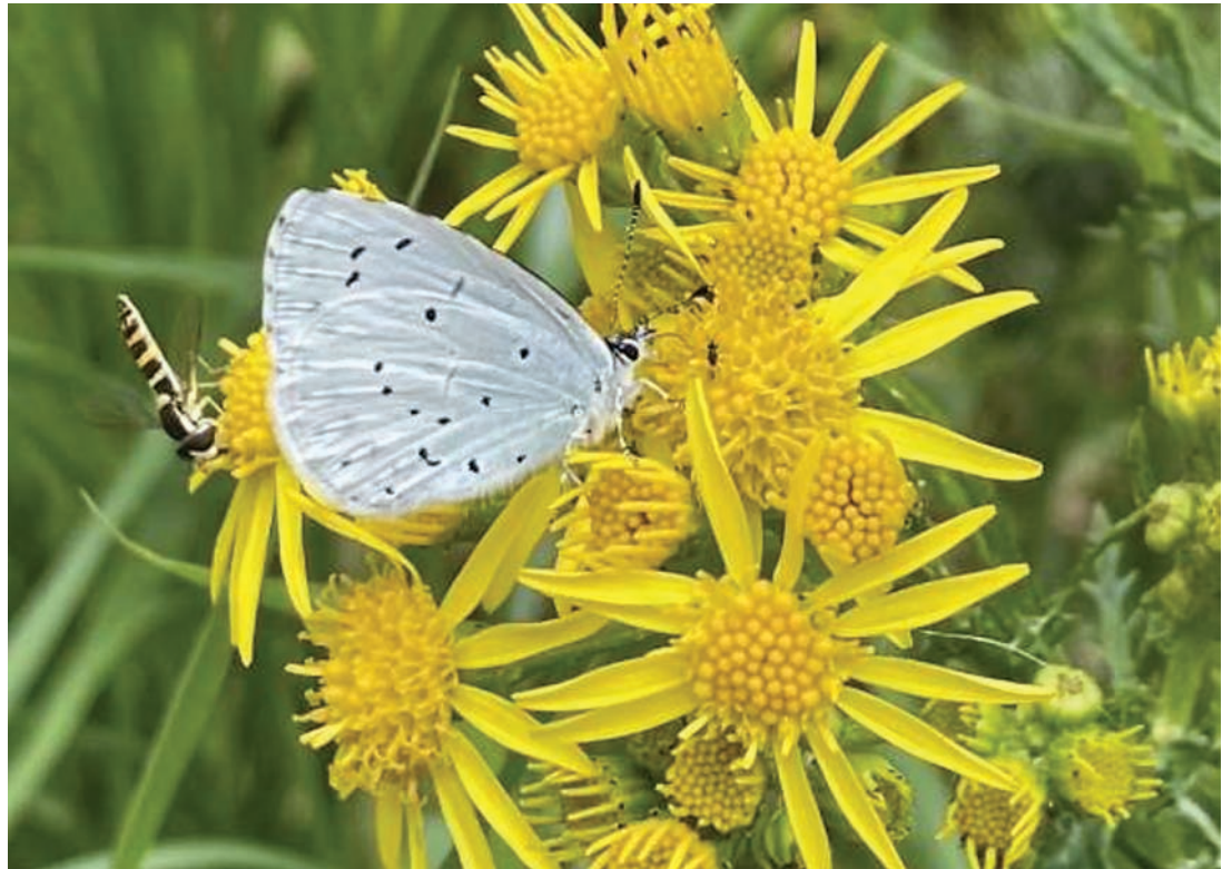
Die Artenvielfalt wird nach Ansicht der Naturschutzbeauftragten Sybille Maurer-Wohlitz durch das Mähen sämtlicher Feldraine stark beeinträchtigt.

schonen und die Artenvielfalt zu erhalten. Ein erneuter runder Tisch im Freien in Pattensen wird vorgeschlagen, um Erfahrungen auszutauschen und Strategien zu entwickeln, wie ein plötzlicher Kahlschlag vermieden werden kann. Ziel ist es, die wertvolle Artenvielfalt auch für zukünftige Generationen zu bewahren.